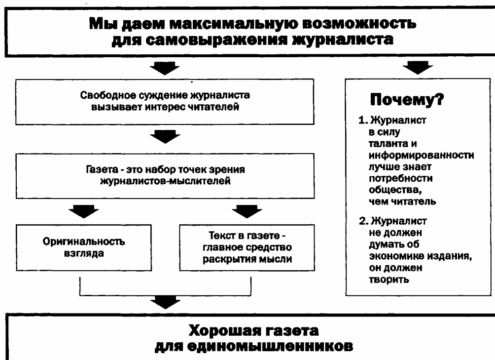
Рисунок 2. Идеология работы традиционной редакции

Однако со временем в редакции стали сомневаться в верности этого принципа. Анализ читательской почты, собственные наблюдения, наконец, оценка результатов