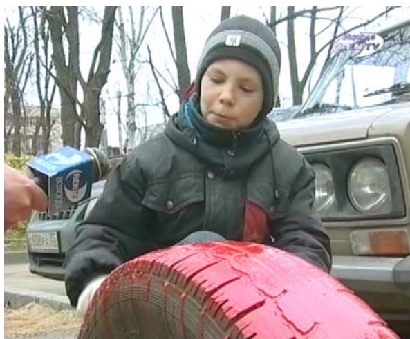
Первое интервью одного из участников акции "Вологодские дворики"

ТК "ННТВ" (Нижний Новгород) провела акцию «Районным библиотекам книги - в дар!» Журналисты предложили всем неравнодушным нижегородцам поделиться своими любимыми книгами с сельскими библиотеками. С такой инициативой телекомпания обратилась к депутатам Законодательного собрания Нижегородской области, бизнесменам, политикам, книготоргующим организациям, типографиям, телезрителям, писательской организации, коллегам из других СМИ. Роль последних – не только информировать о ходе акции, но и участвовать в ней собственными ресурсами: в частности, оформить подписку для нескольких библиотек. Во всех районах города и в фойе телецентра ННТВ организовала пункты приема книг. Но нередко журналистам приходилось приезжать за книгами к телезрителям на дом. Доставка книг в районы области тоже осуществлялась силами телекомпании. Ход акции постоянно освещался в новостях ННТВ.