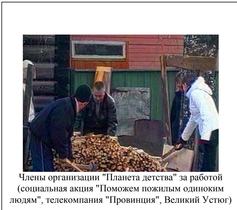
Члены организации "Планета детства" за работой (социальная акция "Поможем пожилым одиноким людям", телекомпания "Провинция", Великий Устюг)

ТК "Провинция" (Великий Устюг) тоже провела в своем эфире акцию помощи одиноким пожилым людям. Партнерами телекомпании стали детские организации "Планета детства" и "Молодежное Единство". Акция началась с объявления в эфире о том, что в городе создается тимуровское движение с целью оказания помощи одиноким пожилым людям. По звонкам зрителей отправились корреспонденты, которые сняли несколько сюжетов о проблемах этой категории населения. Оказать конкретную помощь пожилым – нарубить дрова и сложить их в поленицу, убраться в доме,