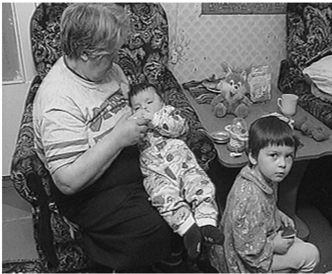
Этой семье пришли на помощь жители Сыктывкара и Республики Коми (акция "Бабушкины дети", телеканал "СТС-Коми")

Адресную помощь семье, в которой после гибели матери воспитание двух детей (4 месячного мальчика и трехлетней девочки) легло на плечи бабушки пенсионерки-инвалида удалось сотрудникам Телеканала "СТС-Коми" (Сыктывкар) в ходе акции "Бабушкины дети". Личным примером (каждый сотрудник телекомпании внес пожертвование) они побудили бизнес-сообщество республики и города, частных лиц оказать материальную поддержку этой семье.