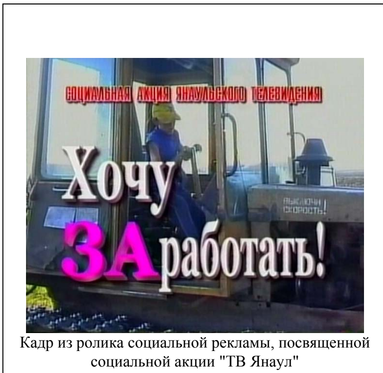
Кадр из ролика социальной рекламы, посвященной социальной акции "ТВ Янаул"

Неожиданный поворот темы помощи детям прозвучал в социальной акции "Хочу Заработать!" ( это не опечатка, так должно быть – И.Е. ) – это была не помощь вещами или деньгами. Сотрудники "ТВ Янаул" (Янаул, Башкортостан) 4 решили помочь школьникам найти работу на время летних каникул. Им удалось привлечь к реализации своей акции сельскохозяйственные кооперативы района и местный Центр занятости.