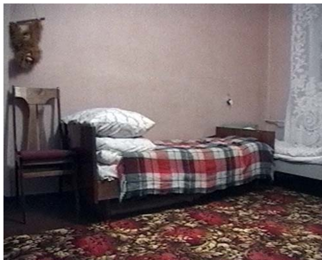
Квартира одной из выпускниц Вуктыльского детского дома, благоустроенная в ходе социальной акции "Доброе сердце".