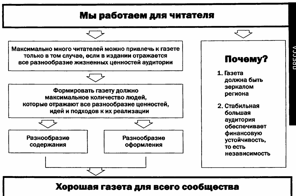
Рисунок 3. Идеология работы в команде