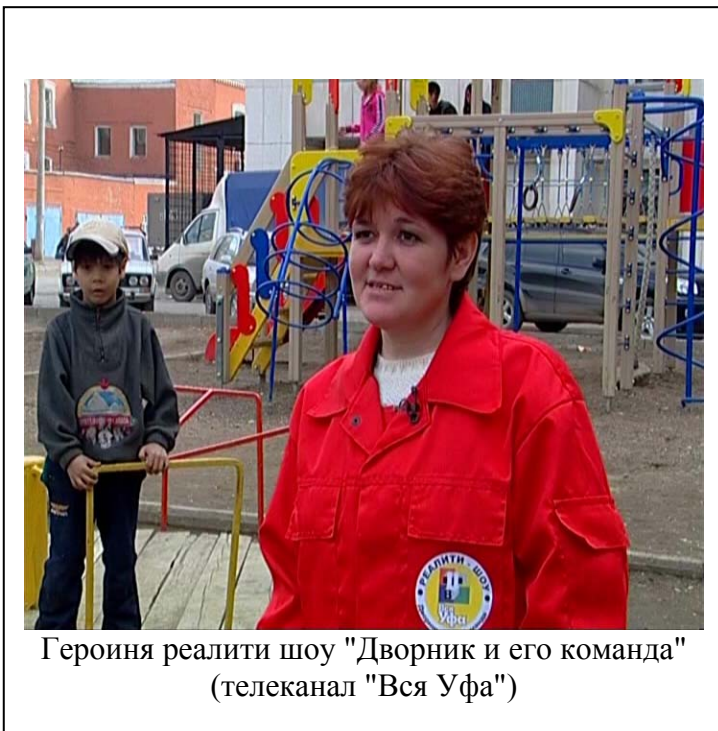
Героиня реалити шоу "Дворник и его команда" (телеканал "Вся Уфа")

В течение 5 недель, с 23 мая по 22 июня 2005 г. Телеканал "Вся Уфа" (Уфа) 6 провел социальную акцию "Дворник и его команда" в необычном для социальных акций телевизионном жанре – реалити-шоу. Главной целью этого проекта явилась поддержка городской программы по внутриквартальному благоустройству г.Уфы, повышение престижа благородной и полезной профессии дворника у горожан, а также привлечение неравнодушных жителей столицы к участию в делах благоустройства города. В телепроекте "Дворник и его команда" была сделана попытка показать телезрителям, что настоящий дворник - это добрый, отзывчивый, трудолюбивый, образованный и разносторонне развитый человек. Каждое из семи муниципальных образований города выставило своего участника. Каждый из дворников впоследствии возглавил команду из 7 человек, членами которой стали жители двора и по два студента Нефтяного и Аграрного Университетов, по проектам