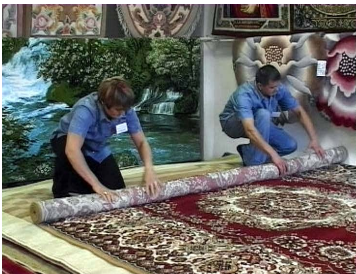
Теплый пол – залог здоровья.

"Чужими дети не бывают" – так назвала свою акцию помощи детям из малообеспеченных сельских семей ТК "НТРВ-АРИС" (Ишимбай, Башкортостан). Сотрудники телекомпании вместе с подростковыми клубами и социальными службами решили подготовить для детей одежду к новому учебному году. Об акции жителям города сообщила и местная газета. Организаторы акции считают, что поставленную задачу они выполнили: удалось собрать все необходимое не только сельским детям из малообеспеченных семей, но и взрослым (на призыв "НТРВ-АРИС" откликнулись не только жители города Ишимбая, но и близлежащих городов - Салавата, Стерлитамака). Помимо детских вещей привезли мебель, бытовую технику, верхнюю одежду. Сбор вещей сопровождался выступлениями детей, подростковых коллективов, ветеранов, коллективов художественной самодеятельности. Телекомпания широко освещала проведение акции в своем эфире. Правда, сотрудники телекомпании признаются и в том, что помощь была оказана выборочно – только нуждающимся деревням Ишимбайского района. Это произошло из-за того, что всю работу телестанция взяла на себя. Тем не менее, акция нашла широкий отклик, и по многочисленным просьбам телезрителей в будущем телекомпания планирует проводить подобные акции регулярно.