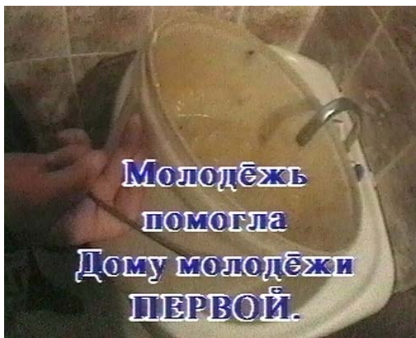
Кадр из репортажа о восстановлении кинотеатра в городе Мценске

ТК "ТВ-М" (Мценск, Орловская область) и Мценский молодежный добровольческий центр взялись восстановить единственный в городе кинотеатр. Сначала они собрали молодежь города на импровизированный теледиспут в жанре «12 этажа» и приняли решение восстановить кинотеатр своими силами. В эфире ТК прошла очень простенькая реклама. Кадр разрушенного